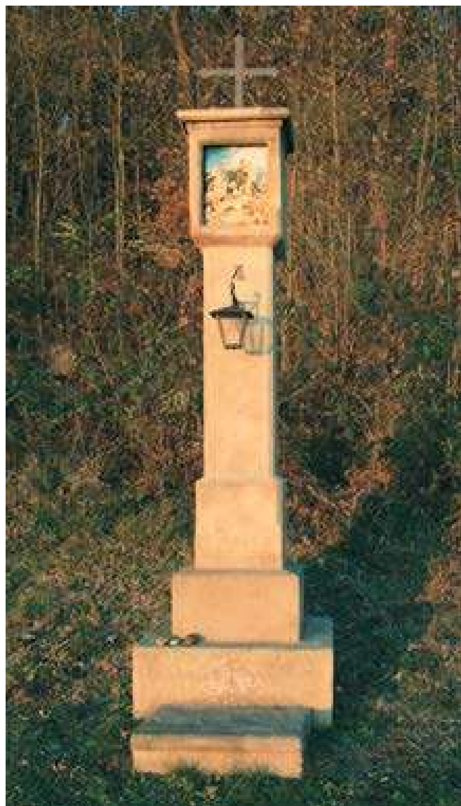
Původní zastavení křížové cesty u Mostiště

hodiny, které tvář jinak příkladně zrekonstruované křížové cesty spíše kazí. Níže přes cestu pod hodinami je dnes umístěn dřevěný altán, z něhož je pěkný výhled na město i okolní krajinu.