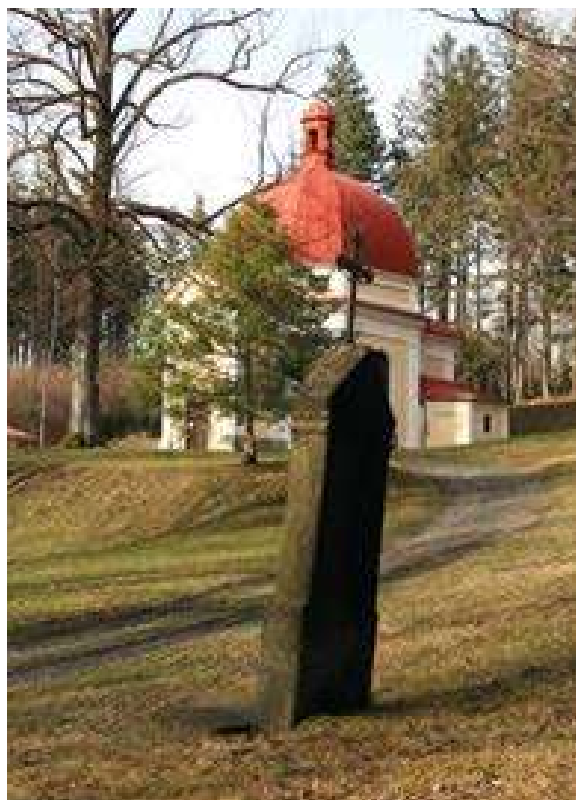
Kaple Panny Marie Bolestné