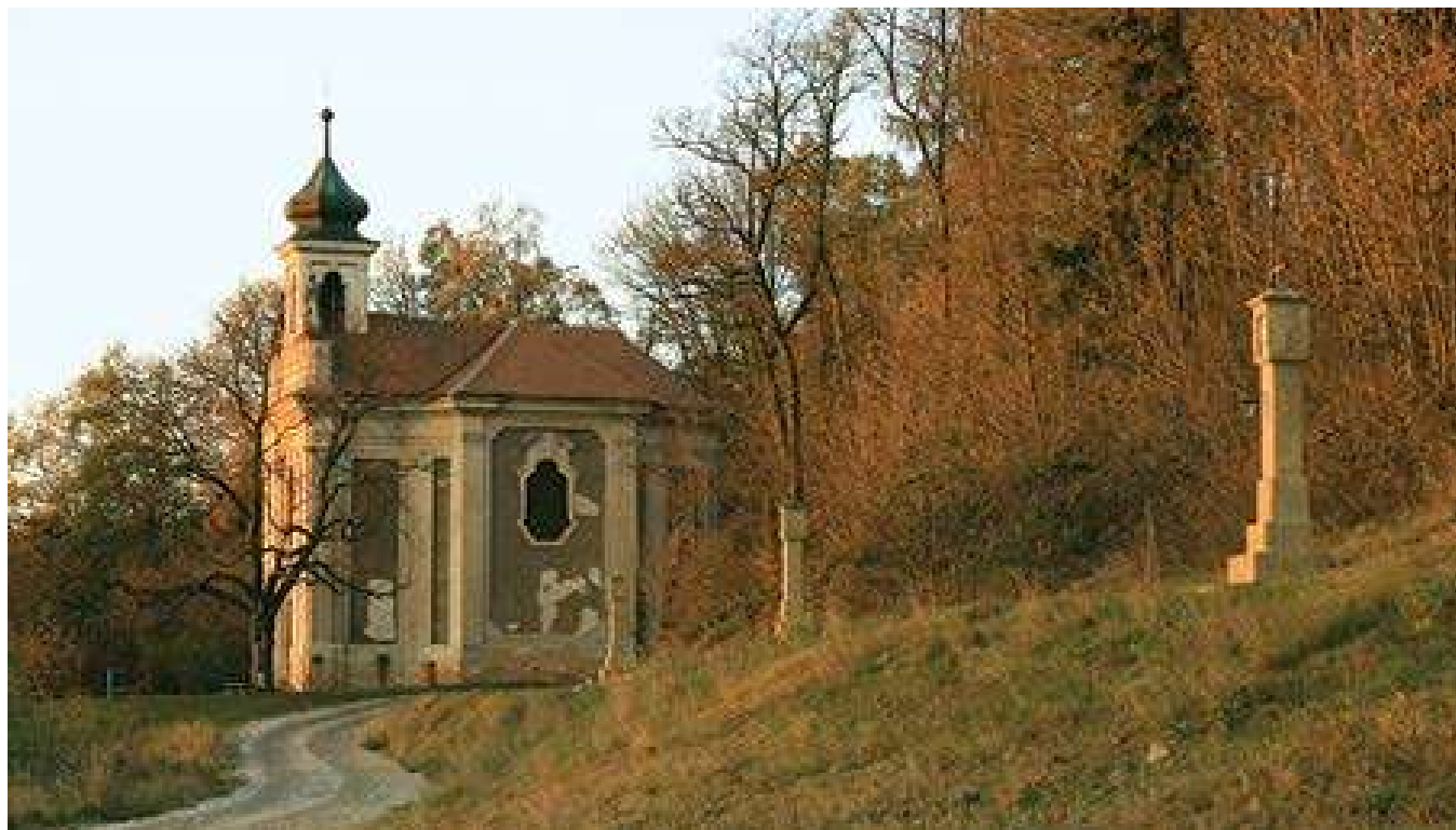
Závěr křížové cesty a poutní kostel Navštívení Panny Marie