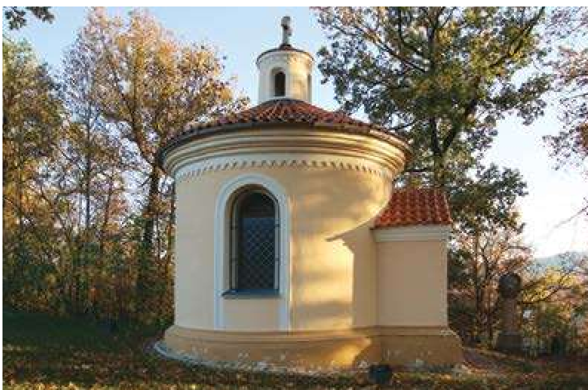
Kaple sv. Kříže

do svahu pravidelnými serpentínami, lemovanými jednotlivými zastaveními, až ke kapli sv. Kříže. Nedávno byla cesta zbavena křovinatého porostu. Návrší Kalvárie je zároveň součástí Přírodní památky Rokycanská stráň. Předmětem ochrany je geologická lokalita s typickým sledem klabavských vrstev barrandienského ordoviku.