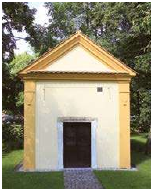
Kaple Panny Marie Bolestné