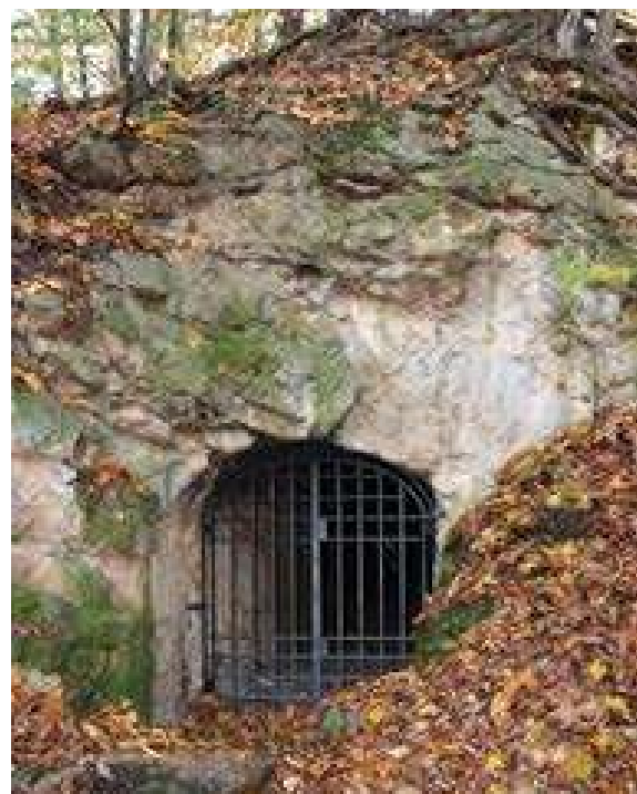
Vchod do jeskyně božího hrobu

Fugela (vybrány jen nejdůležitější postavy výjevů). Návrhy zpracovala MgA. Helena Štěrbová, vlastní malbu na nerezový plech pak provedla paní Anna Urbanová z Kozojed. Jednotlivá zastavení, vysoká okolo 3,4 metru, jsou tvořena kamennými sloupky s číselným označením, osazenými na čtvercových patkách, vrchol je zakončen profilovanou hlavicí s kaplicovým nástavcem a kamenným křížem. V čele kaplicových nástavců byl vždy usazen malovaný obrázek daného výjevu.