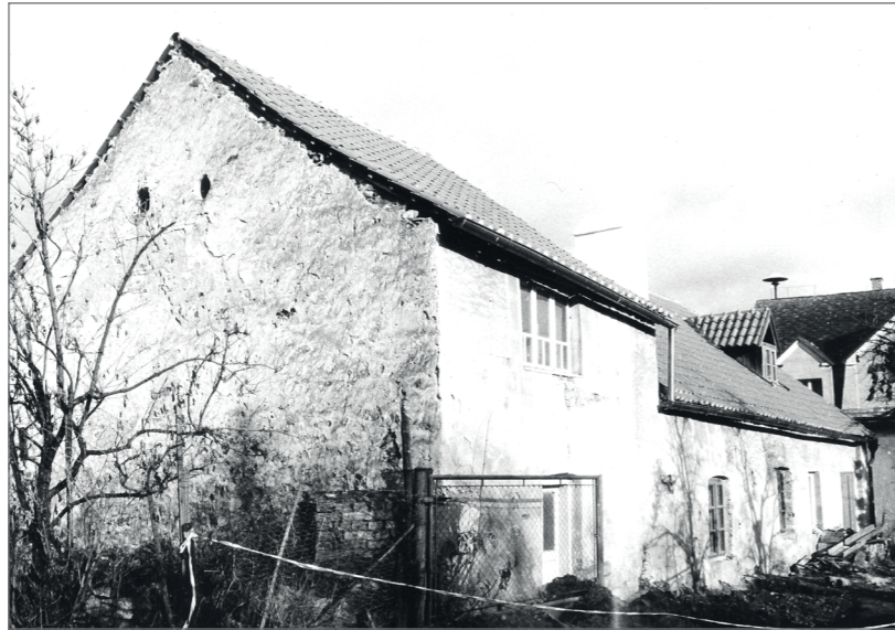
Nezdice na Šumavě, špýcharový dům čp. 1, pohled ze zahrady na sýpku, střední a přední díl stavení.