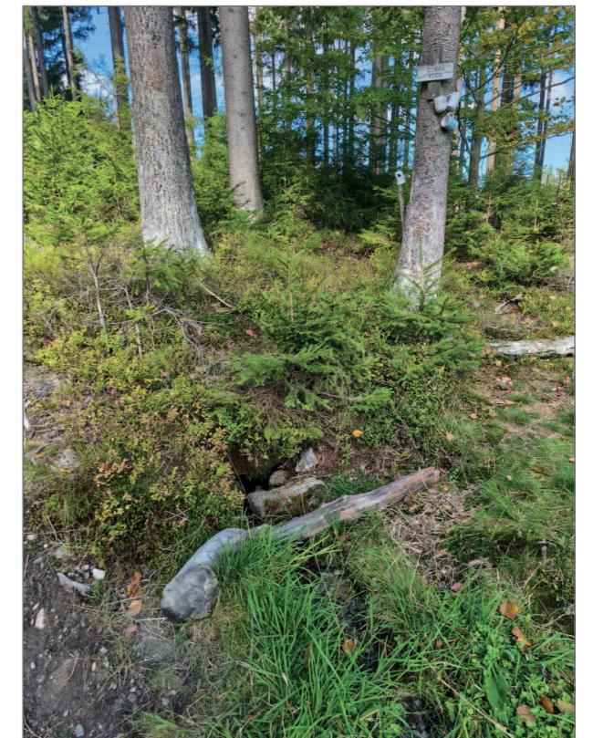
Studánka Dobrá Voda u Postřekova.

Jako závěr nám může posloužit pověst zachycená Jindřichem Šimonem Baarem, která všechny tři chodské Dobré Vody spojuje dohromady: „ Nebožka matka říkávala, že v těchto dnech má všechna voda zázračnou sílu. O Zeleném čtvrtku že se vždycky v jedné studánce voda promění ve víno, o Velkém pátku v krev a o Bílé sobotě, kdy se v kostele světí křestní voda, ve vodu zázračnou. Ty studánky že se střídají, nikdo neví, kterou si Pámbů v našem kraji letos vyvolil, ale voda z ní dostane se do potůčku, a kdo se v ní umyje, jistě dobrého požije; nejen pihy, ale ani nežidi, chrásta, lišeje, ničehož nic se ho nechytí. “ 37