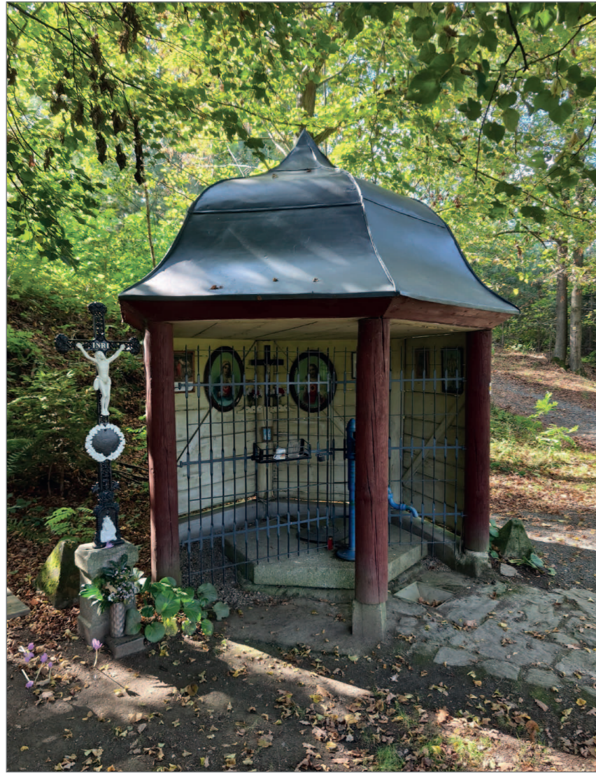
Altánek se studánkou v Dobré Vodě u Draženova (foto L. Krčmář 2025).

bození se zde zúčastnil v roce 1946 slavné pouti Msgre Bohumil Stašek. Dnes je poutní tradice opět obnovena. Hlavní pout se koná poslední neděli v květnu, ostatní poutě na vybrané mariánské svátky. 20