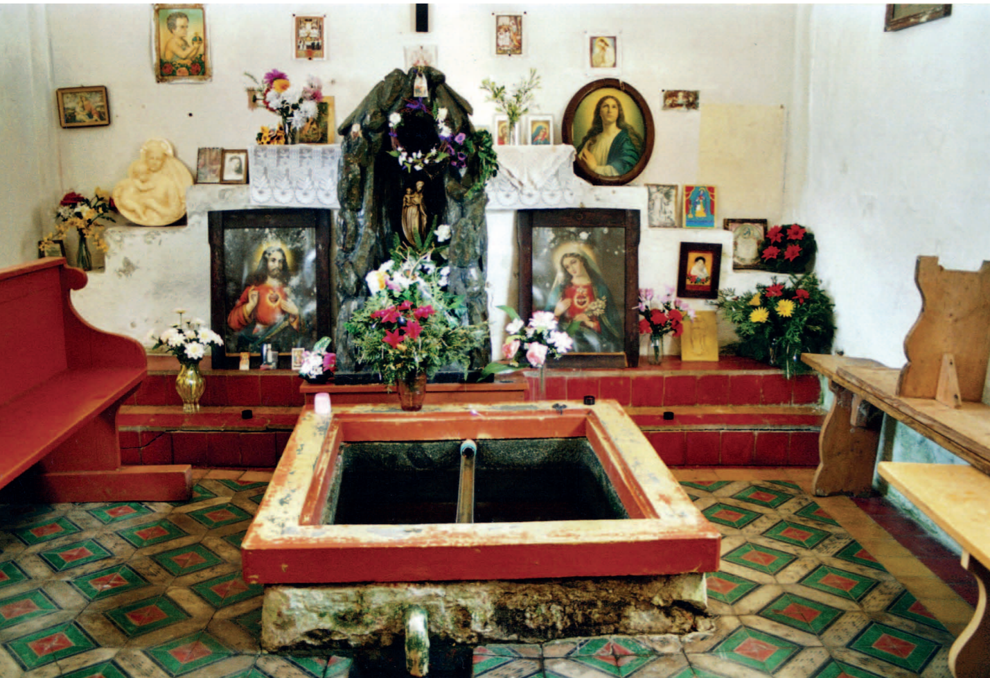
Studánka a lurdská jeskyně (bez sochy Panny Marie Lurdské) v době, kdy ještě byla obklopena bohatou votivní výzdobou, v interiéru kaple Panny Marie Lurdské v Dobré Vodě u Pocinovic.

Maria Sedmibolestná přebývá ve zdejší dobré vodě a oplakává všechny, kteří ve Všerubském průsmyku položili životy při ochraně zemské brány. 30